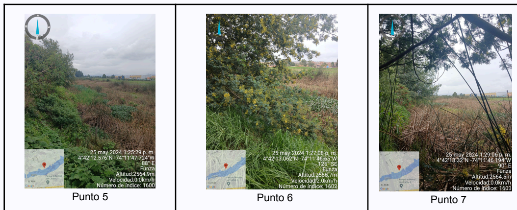
Ilustración 4. Puntos Recorrido De Control Y Vigilancia

C.P 250020 Tel. (601) 8234070 823 40 71 / 823 40 73 Fax. (601) 8257620 Dir. Cra. 14 No. 13-05 03-FR-17 VER.10.2024