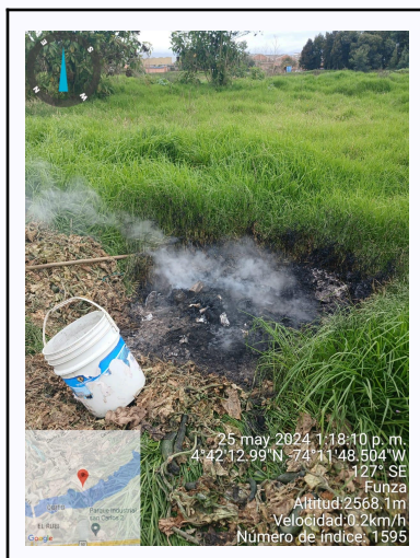
Ilustración 3. Suspensión Actividad Quema A cielo Abierto